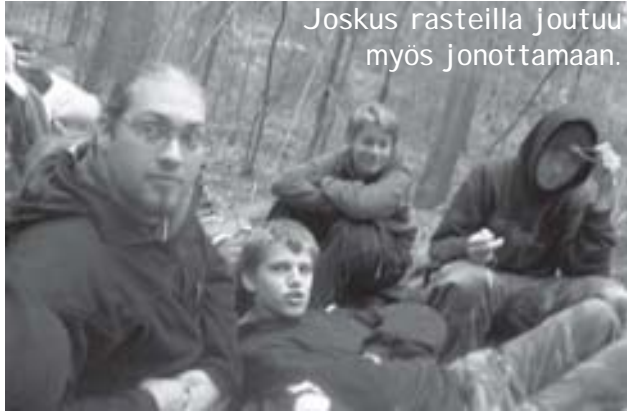
Joskus rasteilla joutuu myös jonottamaan.

le. Yleensä reitti kuljetaan yhdessä vartionjohtajan kanssa. Vartio kulkee ryhmässä annetun reitin, joka on noin 10 kilometriä. Rasteilla harjoitellaan mm. suunnistusta, EA:ta ja muita tärkeitä taitoja.