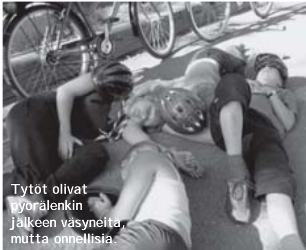
Tytöt olivat pyörälengin jälkeen väsyneitä, mutta onnellisia.

Aamulla herättiin aikaisin ja syötiin aamupuuro. Sen jälkeen pikapakattiin kamat