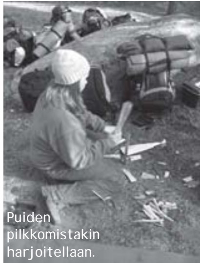
Puiden pilkkomistakin harjoitellaan.

Pinkki on leikkimielinen päiväkilpailu sudenpennuille ja ensimmäisen vuoden pikku partiolaisille. Kilpailussa kuljetaan maastoon merkittyä rataa johtajan kanssa. Radan varrella on hyödyllisiä ja hauskoja tehtäviä. Matkan pituus on 3-8 kilometriä.