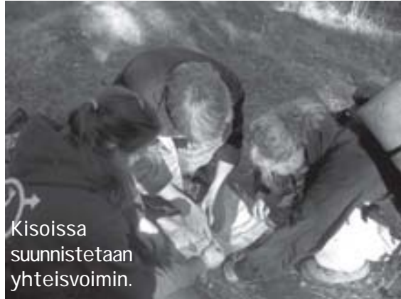
Kisoissa suunnistetaan yhteisvoimin.

Punkku on vartio ikäisille ja sitä vanhemmille partiolaisille tarkoitettu yösarja