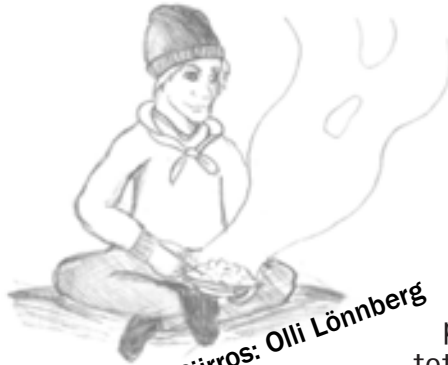
Piirros: Olli Lönnberg

riihityksen järjestäminen on helppoa, kun sen tekee vanhalta pohjalta. “Oikeastaan kaikki rastit oli aika vanhoja”, Jari toteaa. Suunnitteluakaan ei siis tarvittu kolmea sunnuntai-iltaa enempää.