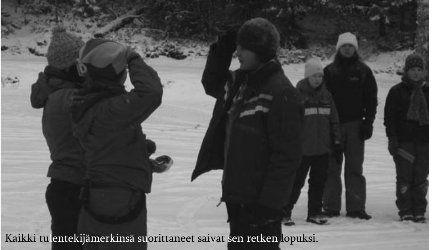
Kaikki tulentekijämerkkinsä suorittaneet saivat sen retken loppuksi.

Hmmhmm.. Retki alkoi lauantaina lu- paavin merkein, paljon veistelyä ja nuotion tekoa.. Haavereita siis luvassa!